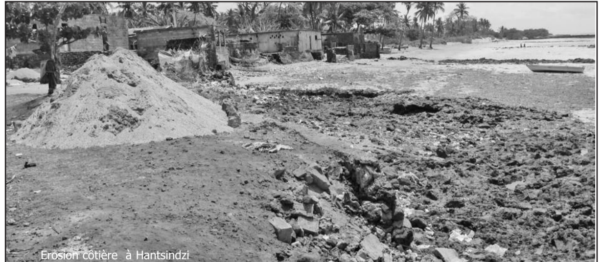
Erosion côtière à Hantsindzi

pour les prochaines années sera le développement des capacités pour lutter efficacement contre la dégradation de l'environnement et une meilleure gestion des ressources naturelles. Le travail pour la mise en place du réseau national des Aires Protégées se poursuit avec le dépôt le mois dernier de la loi à l'Assemblée de l'Union. Par ailleurs un projet portant sur le renforcement des capacités des ressources humaines, du cadre juri-